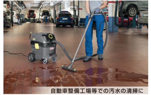
自動車整備工場等での汚水の清掃に