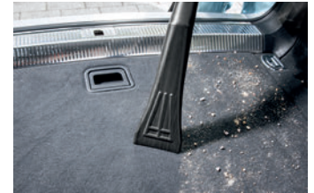
車用ノズル清掃イメージ