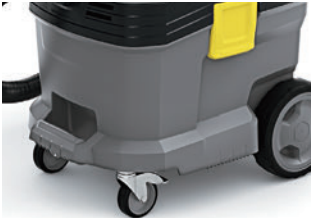
バンパー付きのボディで強度向上

ボディは強化プラスチック製で軽くて丈夫です。作業や移動がスムーズに行え、サビやへこみの心配もありません。