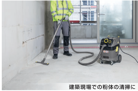
建築現場での粉体の清掃に