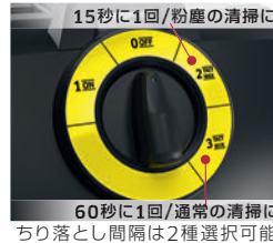
15秒に1回/粉塵の清掃に